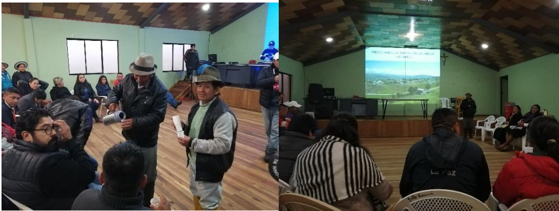
Ilustración 4 Sesión de intercambio de experiencias y plática con la Junta de Guayarumi.