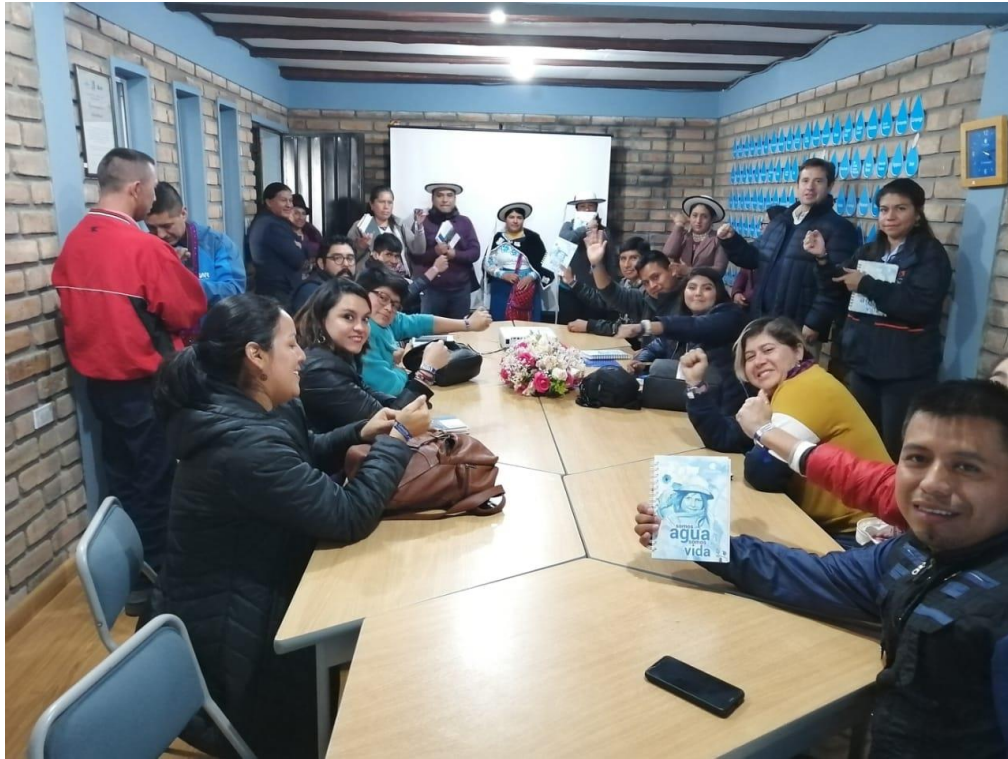
Ilustración 5. Visita a las instalaciones de CENAGRAP. Sesión para compartir experiencias y aprendizajes de CENAGRAP.