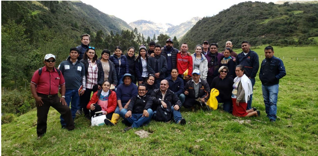
Ilustración 8. Fotografía grupal en el Parque Nacional de Cajas, parte de las áreas protegidas por I Etapa.