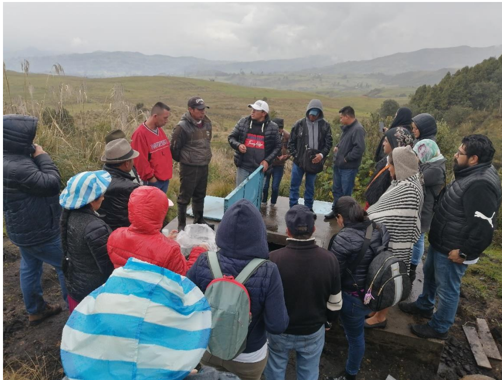
Ilustración 3 Visita en campo al sistema comunitario del agua de la Junta de Guayarumi.