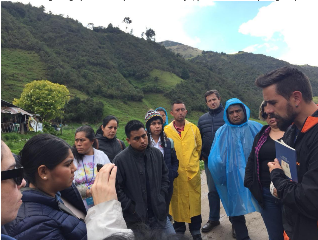
Ilustración 9. Plática con miembros del equipo del Parque Nacional de Cajas, miembros de Etapa.