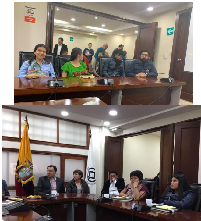
Ilustración 6. Reunión en Cuenca con representantes gubernamentales y la Empresa Pública ETAPA.