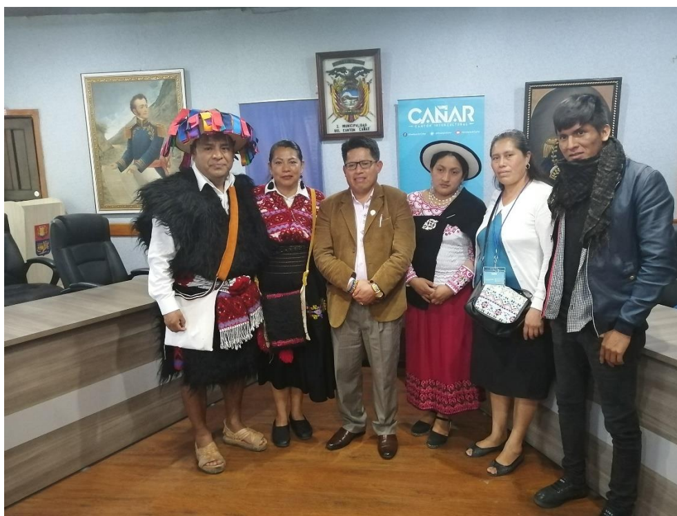
Ilustración 1. Día 1 de la visita. Reunión en el Cantón de Cañar, con participación de gestores del agua de Calakmul y Sierra Zongolica. En la foto están presentes el Alcalde de Berriozábal con su esposa; el alcalde de Cantón Cañar, la Presidente de CENAGRAP, y gestores de Sierra Zongolica y Pantelhó, Chiapas.

Para los gestores comunitarios del agua, la sesión de diálogo fue de lo más enriquecedor. En ella se platicó sobre todo de la parte histórica organizativa de la comunidad, hasta llegar al nivel de junta de agua que tienen en estos momentos. Se platicó sobre resolución de conflictos internos, formas de gestión y recaudación de fondos para operar, transparencia de recursos y los informes presentados antes las familias de Guayarumi.