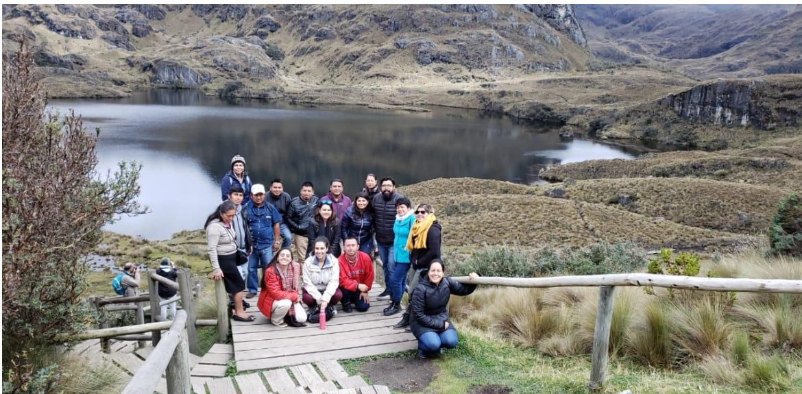
Ilustración 10. Visita a otras partes del Parque Nacional de Cajas.