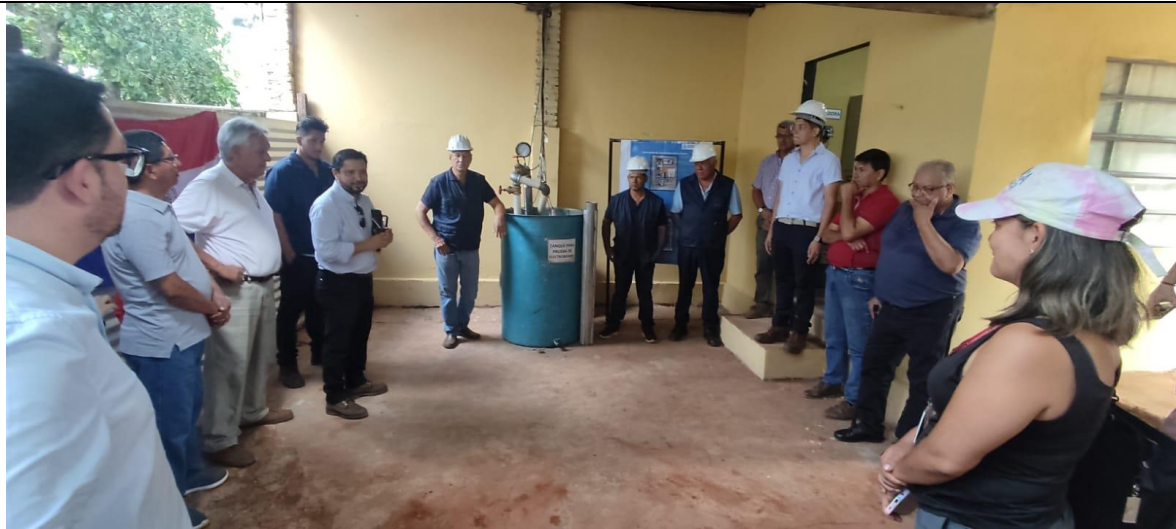
Fig. N° 7: Visita a Banco de prueba de tableros y bombas. DOSAPAS- SENASA, sede San Lorenzo, Departamento Central