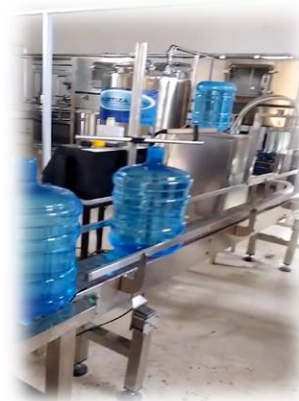
Vista al producto final del sistema de tratamiento y embotellamiento de agua tratada, listo a ser consumido.