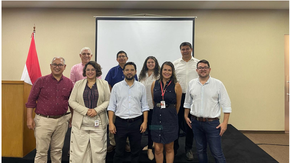
Fig. N° 8: Foto grupal de clausura del intercambio en la ciudad de Asunción, Paraguay.