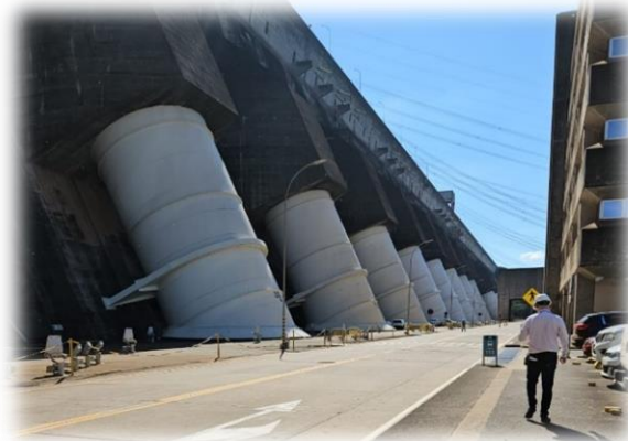
Vista Panorámica de las tuberías que conducen el agua del embalse del río Paraná hacia las turbinas generadoras de energía eléctrica.