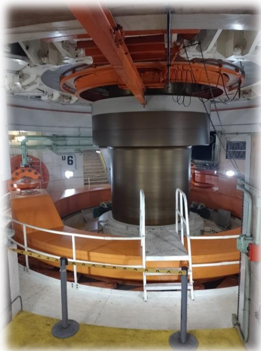
Vista Panorámica de uno de los ejes rotores del eje de la turbina que su movimiento genera la inducción de energía eléctrica.