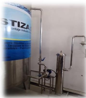
Vista del tanque de acero de agua filtrada, seguido de bomba que conduce el agua para su desinfección por rayos UV.