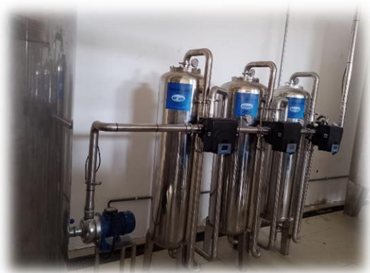
Vista del tanque de acero de agua cruda, seguido de bomba que conduce el agua hacia los filtros de grava gruesa, fina y de Carbón activado.