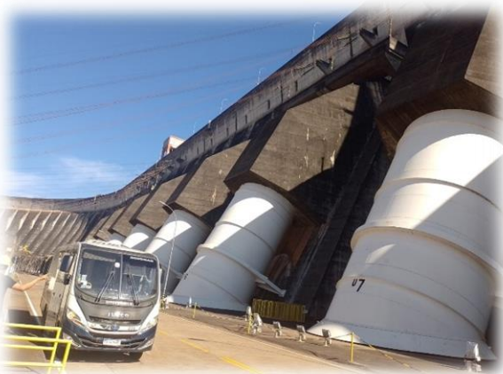
Vista Panorámica de las tuberías que conducen el agua del embalse del río Paraná hacia las turbinas generadoras de energía eléctrica.