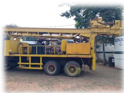
Vista Panorámica a unos equipos perforadoras de pozos tubulares de SENASA.