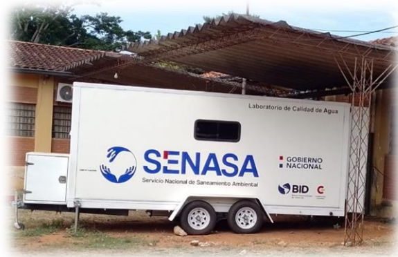
Vista Panorámica del laboratorio móvil de SENASA.