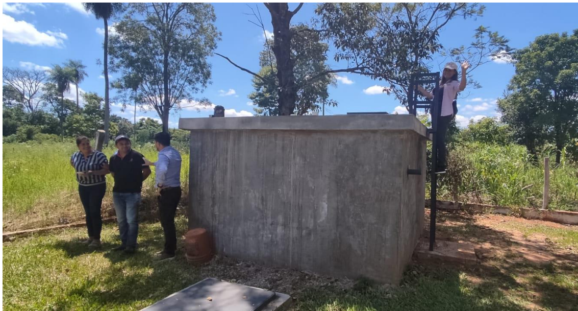
Fig. 2: Visita a obras en ejecución, localidad de Itapé, Departamento de Guairá