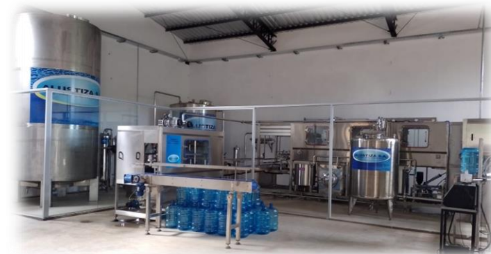
Vista panorámica de la planta embotelladora de agua mineral que está en proceso de puesta en marcha en el SENASA.

La planta embotelladora de agua mineral es una inversión estratégica para garantizar el acceso a agua segura en entornos críticos como hospitales y establecimientos públicos.