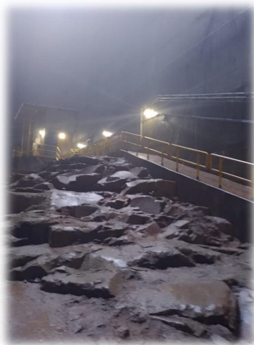
Vista Panorámica del fondo original rocos del río Paraná sobre el cual se asentaron los cimientos de la represa de agua Itaipú..