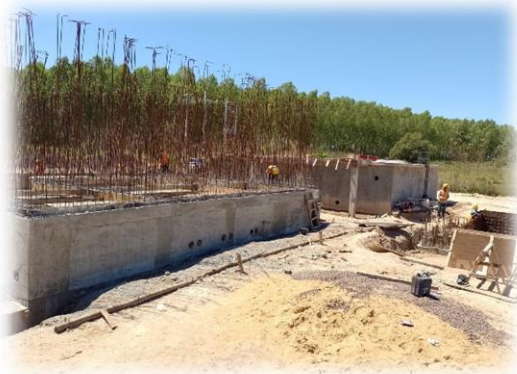
Unidades de Tratamiento compuesto por Floculadores, Decantadores laminares y Filtros Rápidos descendentes de arena.