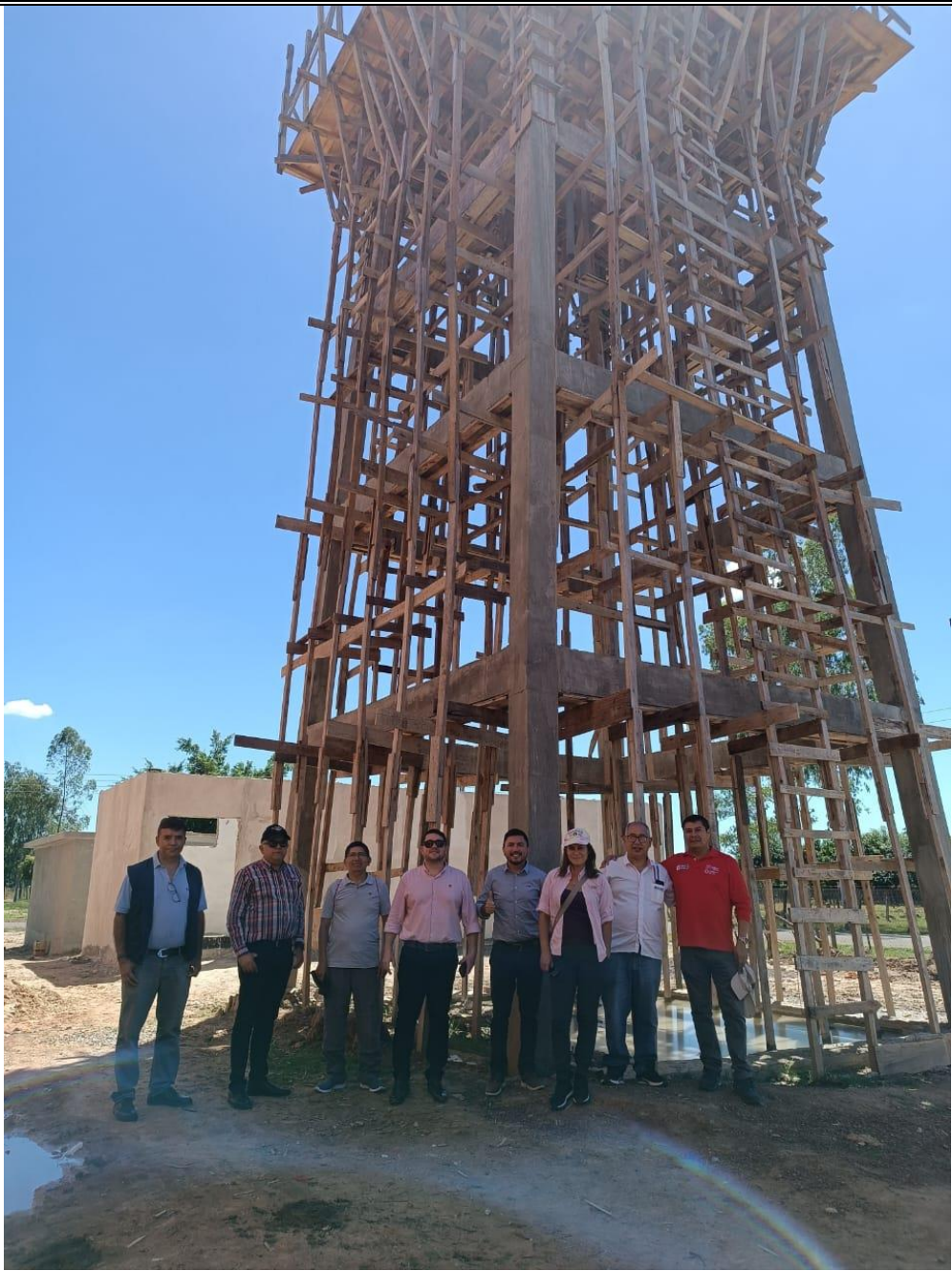
Fig. N° 4: Visita a obras en ejecución, localidad de Itapé, Departamento de Guairá