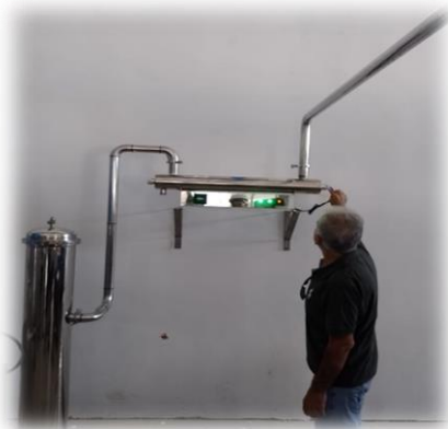
Vista del sistema de desinfección por rayos Ultra Violeta del agua tratada antes de ser embotellada.