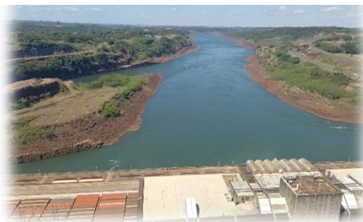
Vista Panorámica de las aguas evacuadas de la represa que sirvieron para el movimiento de las turbinas que generaron la energía eléctrica.