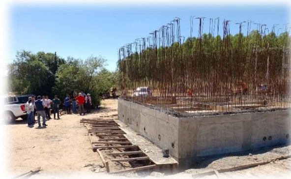
Planta de tratamiento de agua en construcción con capacidad de tratamiento de 130 m 3 /h