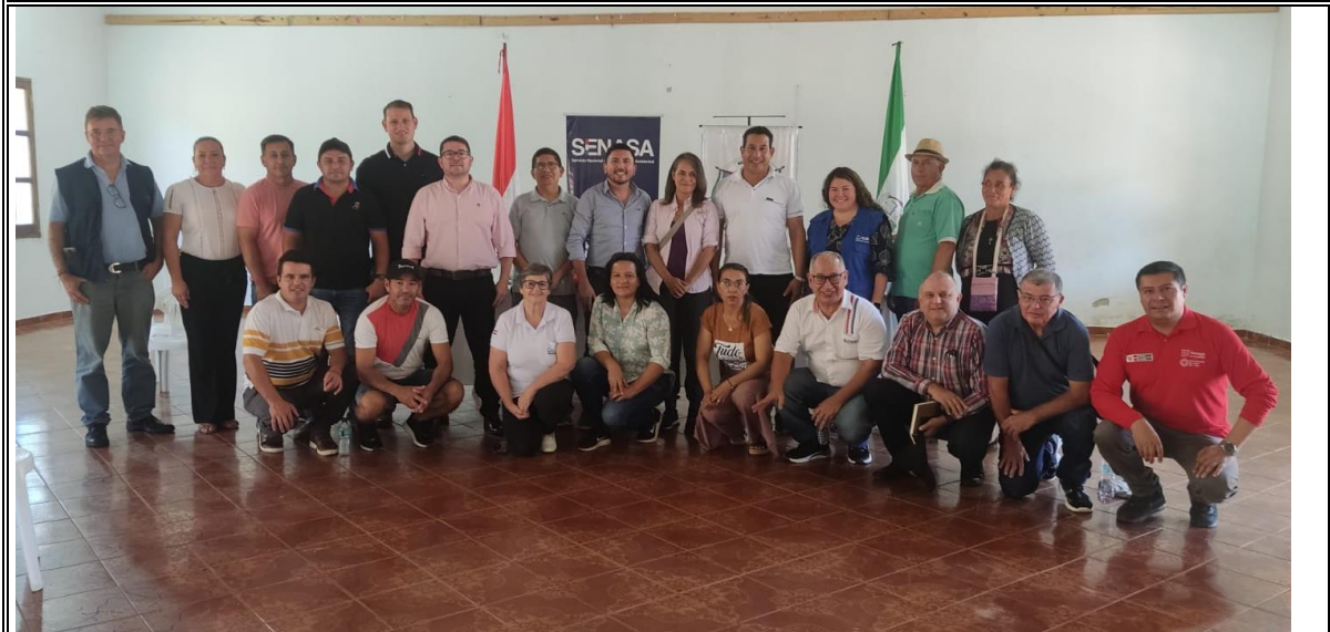
Fig. N° 5: Encuentro con miembros de las Juntas de Saneamiento y autoridades municipales de la localidad de Itapé, Departamento de Guairá.