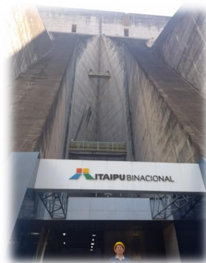
Vista Panorámica de ingreso a la zona de los muros de embalse de la represa Itaipú Binacional.