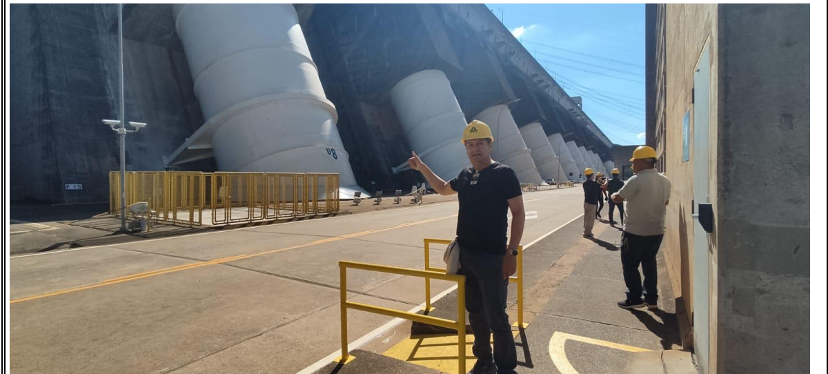
Fig. N° 6: Visita a la Central Hidroeléctrica de Itaipú, ciudad de Hernandarias – Departamento de Alto Paraná (22/02/2024)