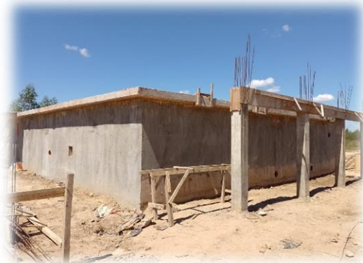
Cisterna construida de 500 m 3 de volumen para captar el agua tratada por la planta.