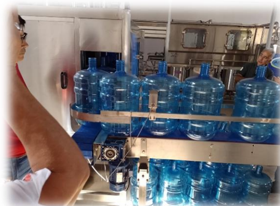
Zona de acopio de recipientes plásticos para su limpieza interior antes de llenarse con el agua tratada.