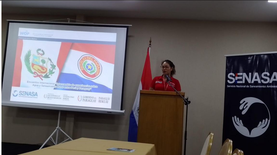
Fig. N° 1: Desarrollo de conferencias, Hotel Guaraní, Asunción.