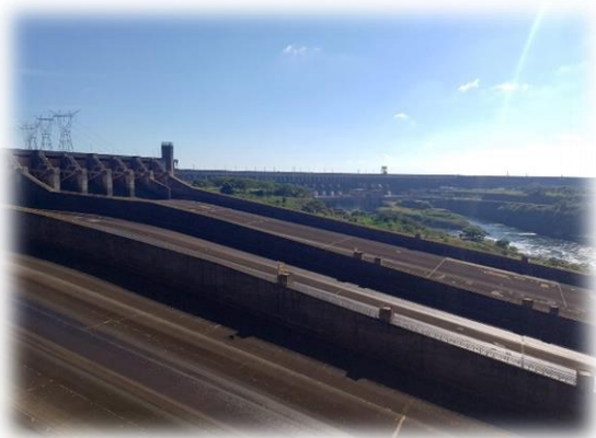
Vista Panorámica de la Central Hidroeléctrica de Itaipú, construido en el cauce del río Paraná en la frontera de Paraguay y Brasil.