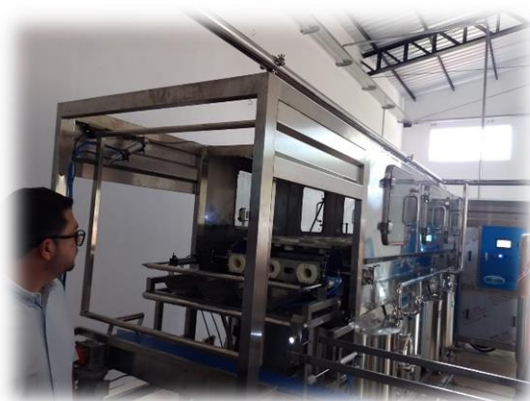
Equipo de limpieza y lavado de los depósitos o recipientes plásticos de 20 litros, antes de llenarse con el agua tratada.