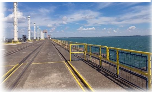
Vista Panorámica de la superficie de agua del embalse del Río Paraná.